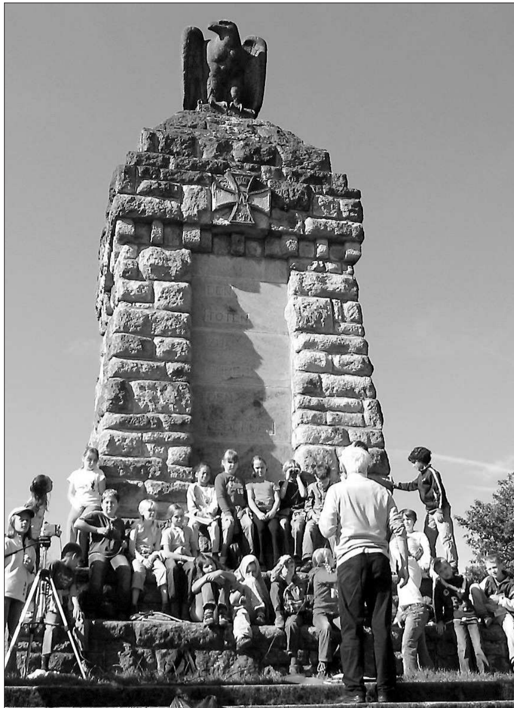
„Eulen“-Exkursion zum Wahrzeichen des Koblenzer Stadtteils Metternich: Die Schülerinnen und Schüler der Klasse 4b der Oberdorf-Grundschule vor dem Denkmal auf dem Kimmelberg, auf dem statt einer Eule ein Adler thront.

Die Eule ist klug. Sie fängt ihre Beute schnell. Eule nachtaktiv. Iyari